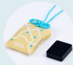
見守り端末 「ビーコン」

お子様に配布したビーコンは、保護者の方のスマートフォンで初期登録をお願いしています。まだ登録がお済みではない方は、下記の特設サイトから無料の初期登録をお願いします。